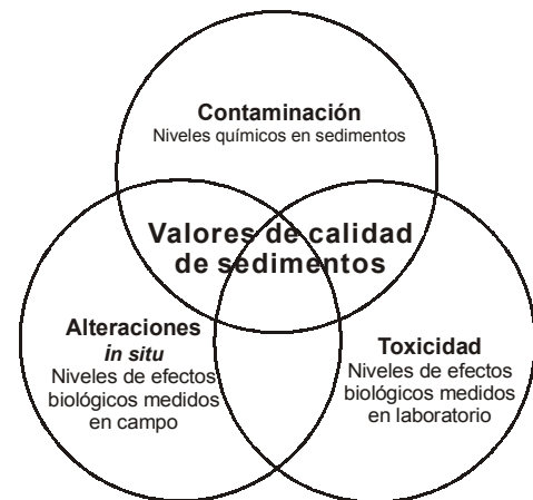
Figura 1. Representación esquemática de la Sediment Quality Triad . El área solapada entre los componentes químicos y biológicos representa la zona disponible para identificar la contaminación existente en el sistema bentónico. Además, en esta zona se pueden calcular, utilizando análisis multivariante, los valores específicos de calidad de sedimento para las zonas estudiadas (SQV) (Obtenido de DelValls y Chapman, 1998).

The ecotoxicological assessment and surveillance of an environmental situation requires the determination of many parameters, taken in a way and sufficient number that will enable conclusions to be obtained through proper statistical analysis. Furthermore, to get a comprehensive idea of the relationships established between parameters, a conceptual approach is required. For this purpose, the TRIAD analysis (Chapman, 1996, 2000), which has already been applied to the