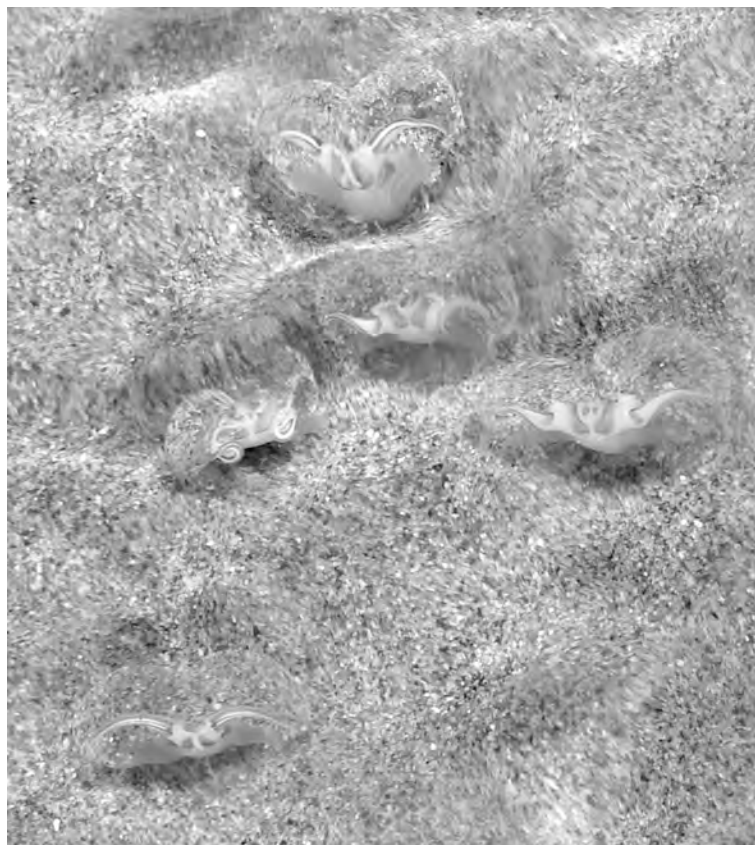
Figure 1. Olivella columellaris in its natural habitat near Colan, Peru, suspension-feeding in the backwash; flow direction is bottom to top. In these animals that are burrowed in the sand, only the propodium (most anterior portion of the foot) is visible. The propodial appendages suspend transparent mucus sheets, which the flow expands into a semispherical shape. Horizontal field width is 5 cm.

Inesperadamente, también observamos individuos de O. columellaris cubiertos permanentemente de agua alimentándose de partículas en suspensión en zonas inferiores de la playa. Aquí los caracoles expusieron las películas de moco cuando el flujo de agua entrante había parado y las