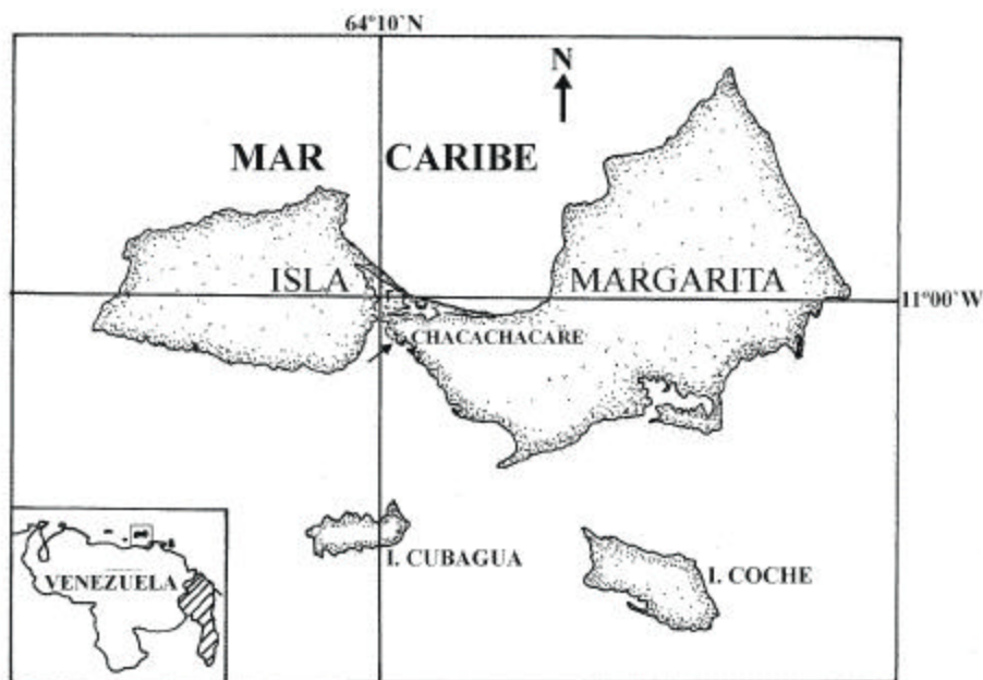
Figura 1. Ubicación geográfica de la zona de muestreo. Figure 1. Location of the sampling site.

hembras juveniles aquellas con el pleón estrecho y adherido al esternón, y hembras adultas las que lo presentaron en forma ovoide y libre.