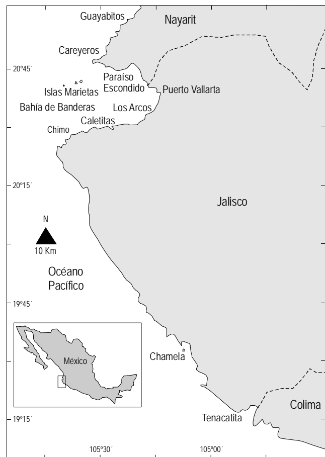
Figura 1. Mapa de Jalisco y Nayarit, en el Pacífico mexicano, y ubicación de las nueve localidades.

Prior to the 1997–98 El Niño event, the coral reefs of Jalisco and Nayarit, in the Mexican Pacific (fig. 1), were dominated by branched colonies of the genus Pocillopora Lamarck 1816, with some small colonies of massive and incrusting corals of the genus Porites Link, 1807 and Pavona Lamarck, 1801 (Carriquiry and Reyes-Bonilla, 1997; Cupul-Magaña et al. , 2000; Medina-Rosas and Cupul-Magaña, 2001–2002). The onset in June 1997 of the most abnormal increase in surface water temperature ever recorded on the Pacific coast of Mexico resulted in mass mortality (96%) of the reef-building corals in several locations of this region by the end of the summer. The